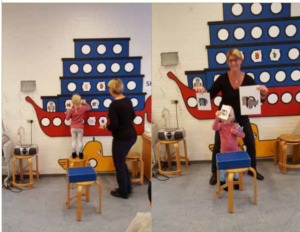
Et lokale specielt til Storbørnsgruppen – med det udstyr de har brug for!

Vores erfaring er da også, at de virkelig er engagerede og nogle er ’begyndende’ læsere, når de starter i børnehaveklassen. Efterhånden har det vist sig, at det primære i samarbejdet med skolen ikke er at lære børnene at læse tidligt, men det viste sig, at overgangen fra børnehave til skole pludselig forløb helt uden problemer for børnene (og forældrene), og dét blev den største gevinst.